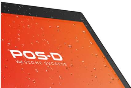
PANTALLA BEZEL FREE RESISTENTE A SALPICADURAS