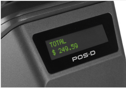
DISPLAY DE CLIENTE